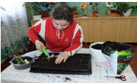
наполнение кассеты почвой