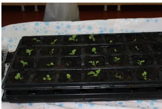
готовая распикированная кассета