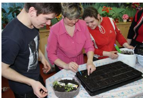
показ приемов пикировки