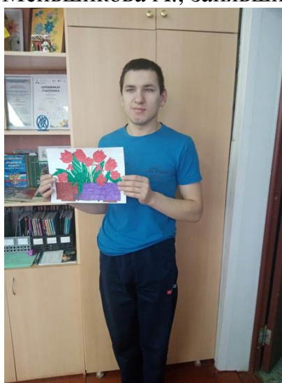
Рисунок Кривенцева И., занявший 3 место