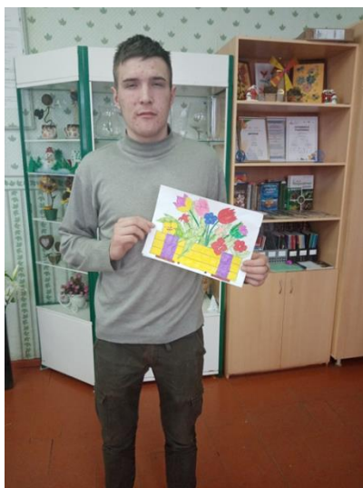
Рисунок Меньшикова А., занявший 2 место